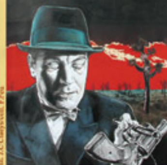
ILL. J.C. Champvillat, F. Feu

Policiers de romans et de laboratoires (conférence / expo / projection)