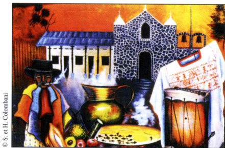
Fresque sur un mur du village de San Juan la Laguna