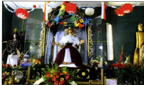
San Simón à Los Angeles